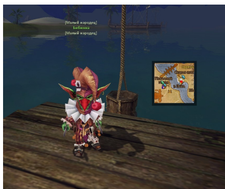
Бибимка в Песках забвения.

Для того, чтобы купить рецепты на создание вещей синего качества, нам необходимо телепортироваться в локацию Пески забвения. Из Песчаного города мы отправляемся через мнемолит на Забытую Станцию и ищем на причале НПС Бибимка, у которого и продаются желаемые нами рецепты.