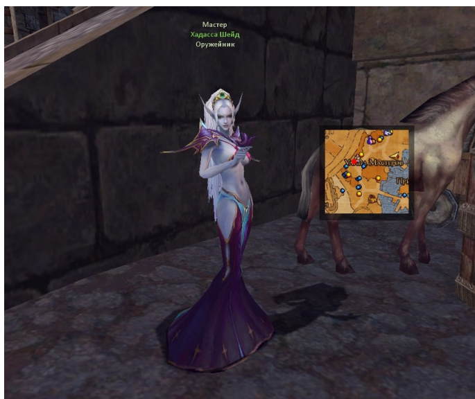
Хадасса Шейд в Вольной гавани.

Достигнув 40 уровня, любой игрок может стать Оружейником, имя которого запомнят все жители мира Эйры. Для этого нам понадобится всего одно свободное очко профессии, а так же придется найти в Вольной гавани на Улице Мастеров загадочную наставницу Оружейников Хадассу Шейд. Она стоит неподалеку от хорошо всем известного Кузнеца Николаса, поэтому найти ее будет не трудно.