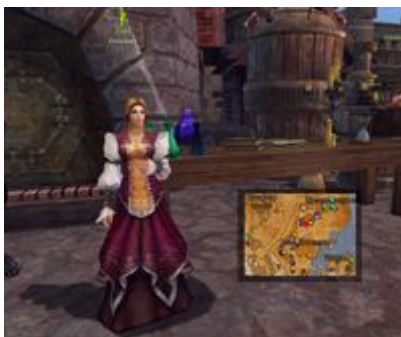
Алхимик Хлоя в Вольной гавани.

Профессия Алхимика доступна всем игрокам с 10 уровня. Освоив эту профессию, вы сможете готовить различные снадобья, которые будут помогать вам во время боя: зелья, восстанавливающие ОЗ и ОМ, снадобья, увеличивающие атаку, сопротивление или защиту, а так же Грезы, необходимые для поднятия опыта. Некоторые зелья будут необходимы для выполнения квестов.