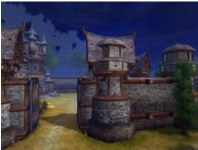
Лагерь львиных сердец