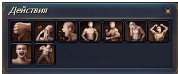
Окно с действиями.

Чтобы просмотреть доступные вам действия, достаточно нажать на значок движения, расположенный